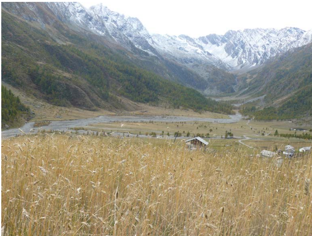
Segale lasciata in campo a fine estate, Pra (Bobbio Pellice).

Per quanto riguarda le altre tipologie di coltivazione sono stati effettuati i seguenti lavori: