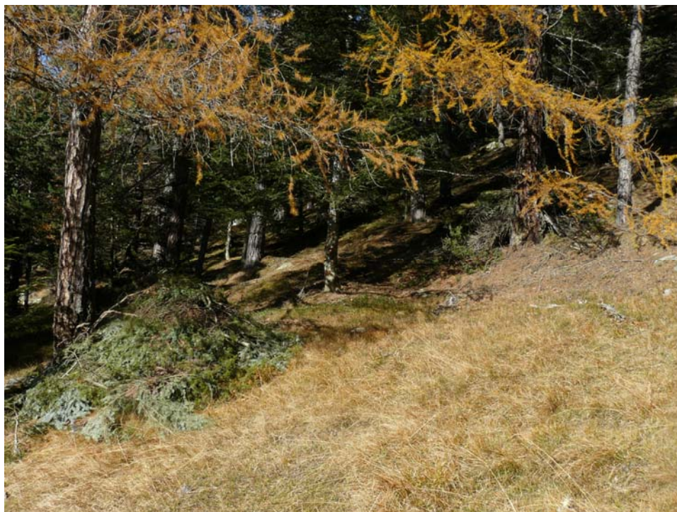
Sramatura dei rami bassi per apertura del pascolo, Subeirán, Perrero.

I Comuni interessati dagli interventi sono 8, di cui 4 ricadono in Val Pellice, 2 in Val Germanasca, 2 Val Chisone.