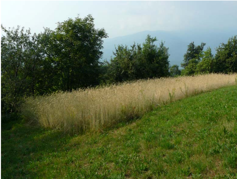
Segale in maturazione, Ciava superiore (Angrogna).