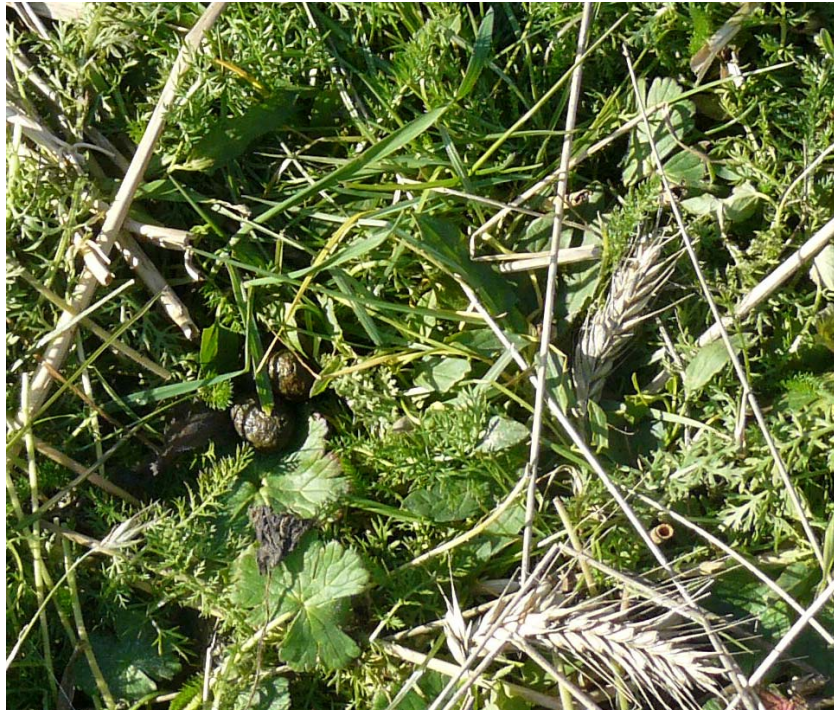
Fatte fresche di Lepre comune, in campo seminato l'anno precedente, Perrero.